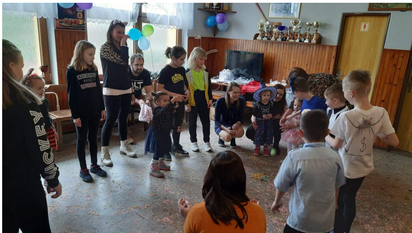
Dětský karneval 11. 3. 2023