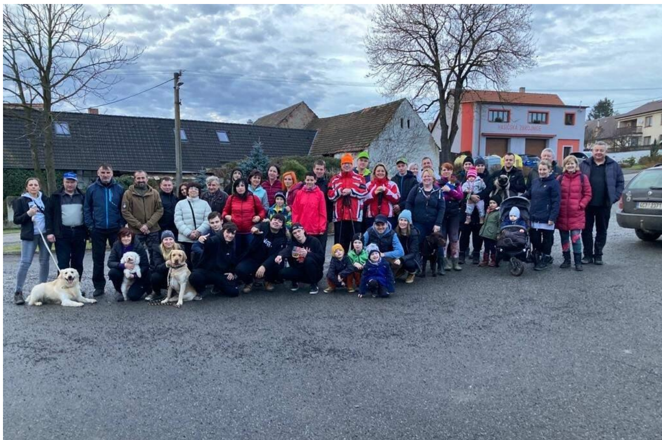
Silvestrovský pochod 31. 12. 2022